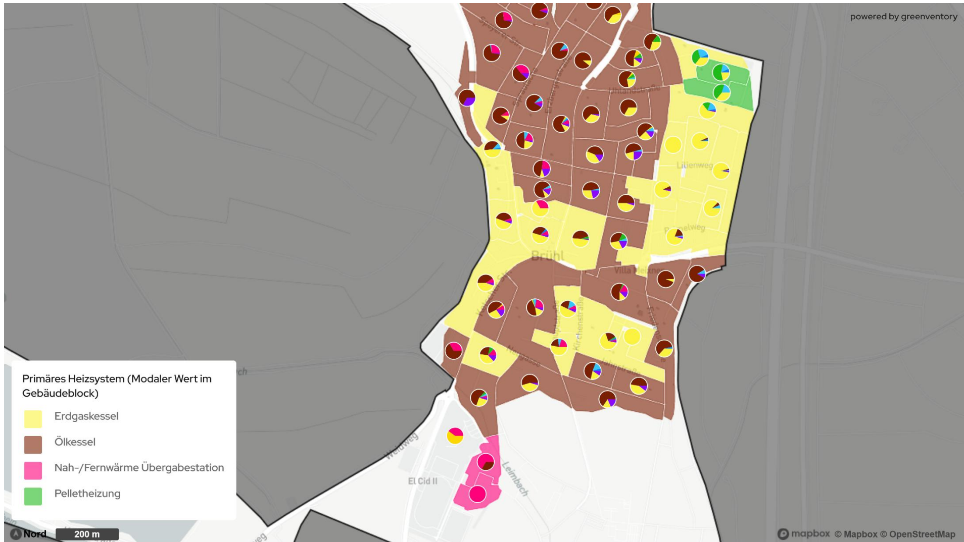
Abbildung 2: Teilausschnitt Süd