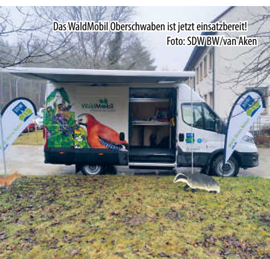
Das WaldMobil Oberschwaben ist jetzt einsatzbereit!