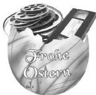
Photo & Film Medien bietet verschiedene Möglichkeiten der Absicherung für alte Aufnahme Medien an, wobei immer die dauerhafte Archivierung im Vordergrund steht.

Ihr 1A-Fotofachgeschäft - Photo & Film Medien Eichelweg 6 (im REWE-Markt) 69168 Wiesloch Telefon 06222 664422 www.multimedia-tp.de