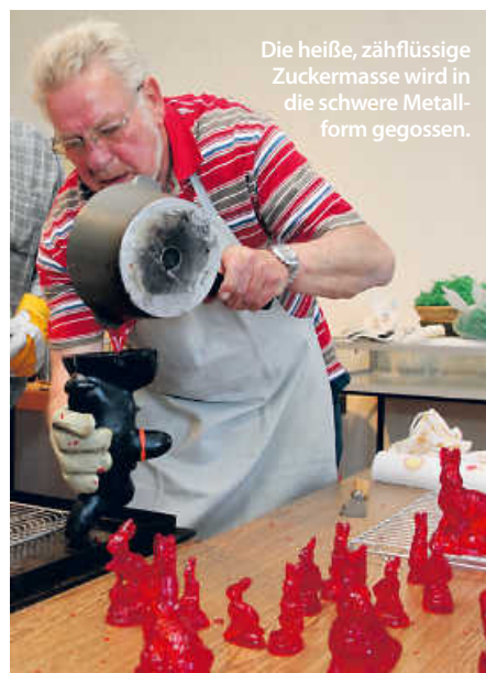
Die heiße, zähflüssige Zuckermasse wird in die schwere Metallform gegossen.

Zum Abkühlen wird die Form auf einen Metallrost gestellt. Zurück bleibt eine hohle, dünnwandige Figur. Nach dem Aushärten muss der überschüssige Zucker abgeklopft werden.