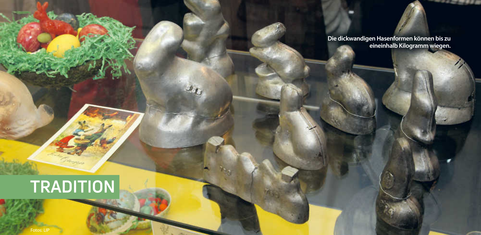
Die dickwandigen Hasenformen können bis zu eineinhalb Kilogramm wiegen.