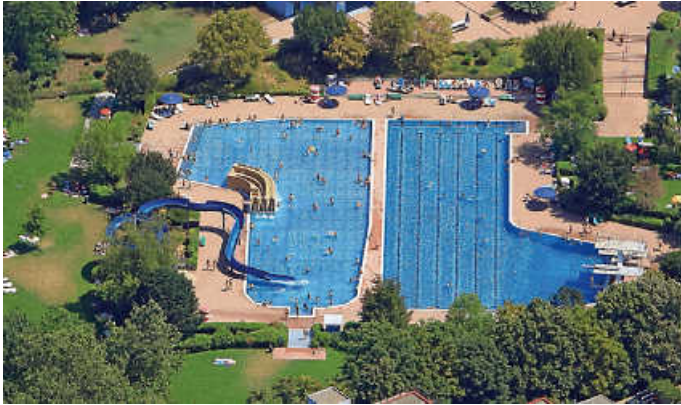
Das Brühler Freibad präsentiert sich wie ein Park mit großen Wasserflächen

Mit Blick auf die Besucherstatistik zeigen sich die Verantwortlichen des Brühler Freibads nicht ganz zufrieden. Ursächlich hierfür ist das, besonders in den Monaten Mai und Juni, wechselhafte nicht sommerliche Wetter. Wenigen durchweg sonnigen Tagen standen viele bewölkte und regenreiche Tage gegenüber. Erst der Spätsommer polierte die Saisonbilanz etwas auf.