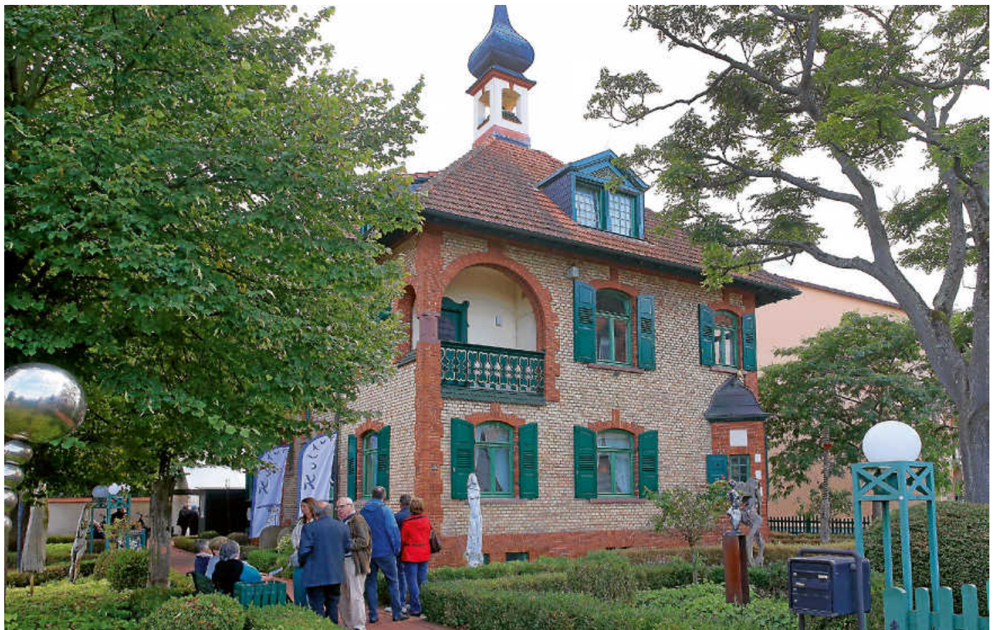
Die Villa Meixner mit ihrem Jugendstil-Charme steht seit 125 Jahren und ist seit fast 40 Jahren ein Kulturzentrum der Hufeisengemeinde