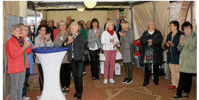
Der gut besuchte Jubiläumsempfang fand im Garten der Villa Meixner statt