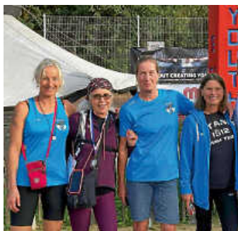
Team SV Hellas Brühl