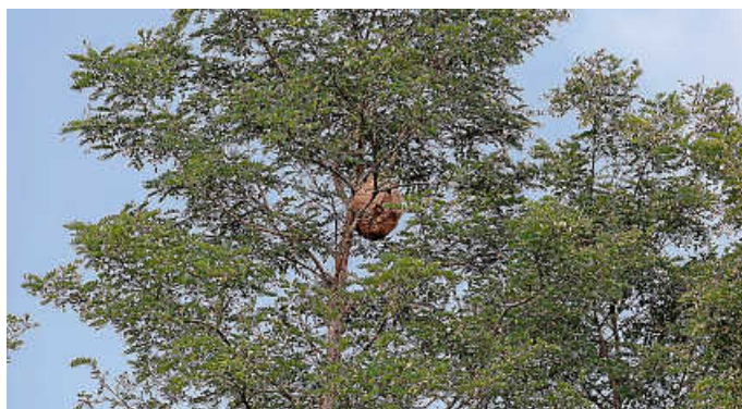
Sekundärnest der Asiatischen Hornisse im Spätsommer – meist hoch in den Bäumen, mit bis zu 2.000 Tieren

Nicht nur Imkern im Rhein-Neckar-Kreis bereitet die Ausbreitung der Asiatischen Hornisse große Sorgen. Die invasive, gebietsfremde Art bedroht nicht nur Honigbienenvölker, sondern kann auch Schäden im Obst- und Weinbau verursachen.