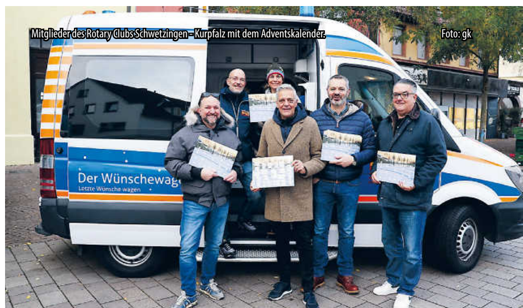
Mitglieder des Rotary Clubs Schwetzingen-Kurpfalz mit dem Adventskalender.

Rotary-Adventskalenderverkauf Schwetzingen, Kleine Planken, Ecke Mannheimer/Dreikönigsstraße, Sa., 16.11., 9 - 13 Uhr