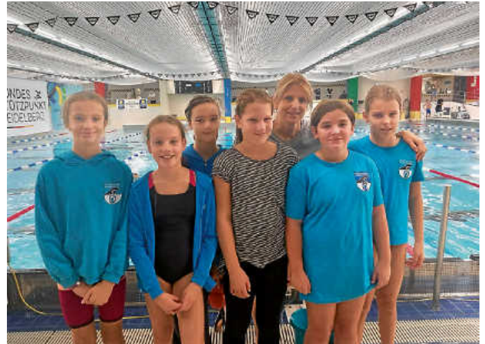
Team SV Hellas mit Trainerin

Das genaue Ergebnis und das Protokoll befindet sich zum Nachlesen auf der DSV-Homepage.