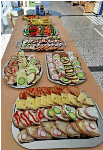
So lecker und bunt sieht das gesunde Frühstück in der Schillerschule aus

In der Schillerschule in Brühl und im Rohrhof duftete es in den vergangenen beiden Wochen wieder nach frisch geschnittenem Obst, knackigem Gemüse und leckerem Brot. Der Grund dafür: Das beliebte „Gesunde Frühstück“ stand wieder auf dem Programm. Ein Projekt, das nicht nur den Kindern Freude bereitet, sondern auch eine wichtige Botschaft vermittelt.