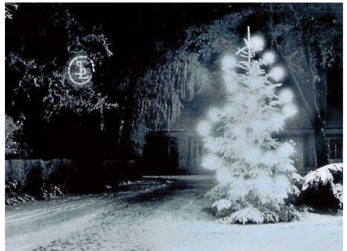
Das Foto hinterließ der frühere Vorsitzende Hans Weihe und bemerkte dazu auf der Rückseite: „Weihnachten 1948. Einfahrt in das Werks-gelände von Schütte-Lanz ... eine Grußkarte von SL.“

Mit dieser Weihnachtskarte aus dem Jahr 1948 wünscht der Verein für Heimat- und Brauchtumpflege Brühl/Rohrhof e. V. allen Lesern eine schöne Adventszeit.