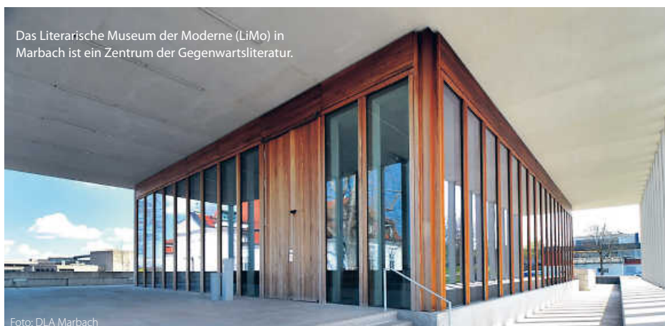
Das Literarische Museum der Moderne (LiMo) in Marbach ist ein Zentrum der Gegenwartsliteratur.

Ob Klassiker oder Bestseller, historische Manuskripte oder Poetry-Slams – Baden-Württemberg zeigt, dass Literatur hier nicht nur geschrieben, sondern gelebt wird. (jr)