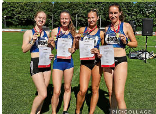
Oben: Kreismeister Mannschaft MU12; unten: Badische Meisterinnen 4 x 100 m