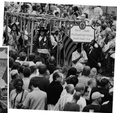
Viel Publikum war überall

Diese gute Stimmung kam nicht von ungefähr; sie ist vielen Mitwirkenden, Organisatoren, Vor- und Mit-Denkern, Gastgebern und Gästen, geduldige und kreative Zelt- und Umzugs-Anwohner, aber auch Einsatzkräften und den Mitarbeiterinnen und Mitarbeitern der Gemeinde zu verdanken. Alle haben Beiträge zu dem Wochenende geleistet und mit den anderen zusammengearbeitet. Ganz persönlich aber auch im Namen der Gemeinde Brühl danke ich allen, die dieses Wochenende zu einem Erfolg haben werden lassen. Ich freue mich, dass alles, was über zwei Jahre geplant wurde, so schön und reibungslos abgelaufen ist.