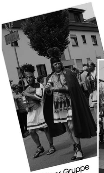
Römer-Gruppe beim Umzug

„sangen die "Fabelhaften Shakerboys" bei der Umzugs-Party am Sonntagabend im Festzelt gleich viermal und drückten mit ihrem zum Jubiläum komponierten und getexteten Brühl-Song die tolle Stimmung an dem Festwochenende gut aus (ganzer Text im Inneren).