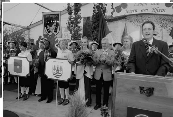
Eröffnung des Brühler Abends