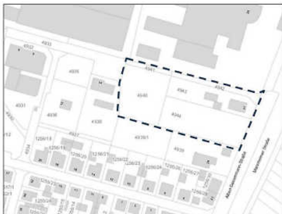
Möglicher Geltungsbereich eines Bebauungsplans „Traumannswald – 2. Änderung“

Wir freuen uns sehr auf Ihre Teilnahme und das gemeinsame Gespräch.