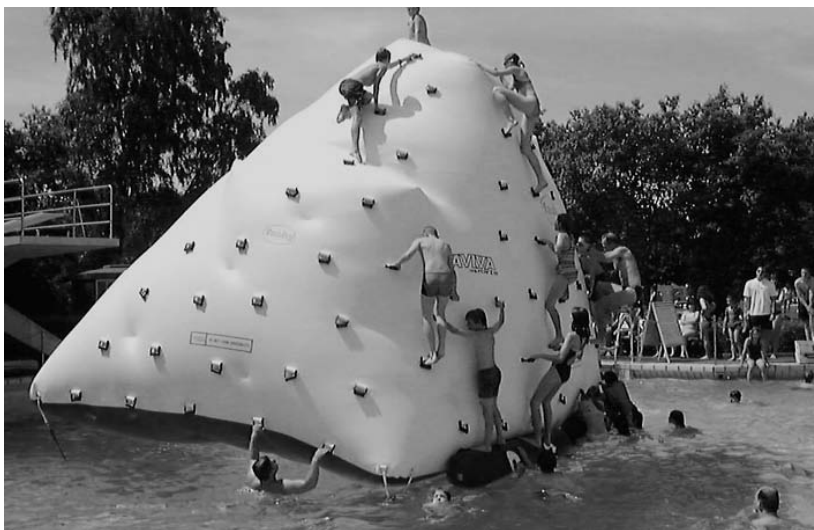
Der Free Climbing Iceberg ist eines der Wasserspielgeräte am 31. August