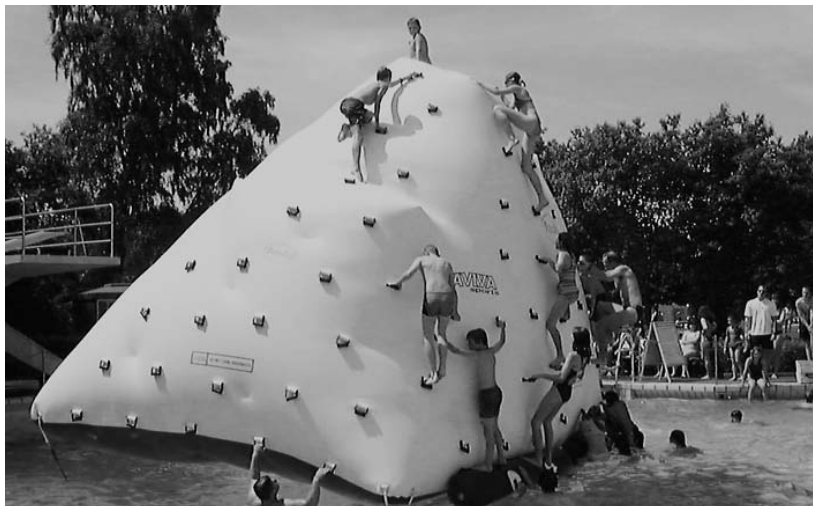
Das "Action-Team" bringt am 31. August viel Bewegung in die Freibad-Becken, unter anderem auch einen überdimensionalen Eisberg.

Auch für die Jugend soll im Jubiläumsjahr einiges geboten werden. Deswegen war schon Big FM im Freibad und als größtes Event wird am Freitag, 31. August, die Fun-&-Action Poolparty viel Spiel und Spaß, Kinder-Animation mit Action rund um die riesigen Wasserspielgeräte in das Freibad am Schrankenbuckel bringen. Mit einem Spielpark, einer Bademodenschau und einem Live-Musicact bietet das Action-Team von "H20" einen ganz besonderen Tag. Zuletzt hatte man diese Veranstaltung vor fünf Jahren anlässlich des Freibad-Jubiläums zu Gast. Und das Schönste: Es wird kein Extra-Eintritt, sondern nur der übliche Eintrittspreis verlangt (auch die Saisonkarten haben Gültigkeit), die "Poolparty" ist der Beitrag des Freibad-Teams zum Gemeindejubiläum.