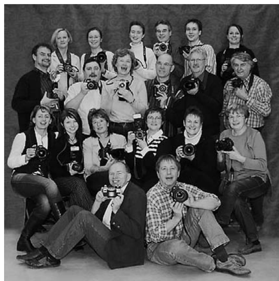
Fünf der insgesamt 20 Mitglieder des FC "Reflex" waren im Juni in Brühl und bannten das Festwochenende auf Zelluloid.

Nach der 20-minütigen Dia-Show über das Festwochenende und einer lustigen Präsentation des Fotoclubs "Reflex" zeigen die Weixdorfer anschließend schöne Bilder von Dresden und von einem Trip nach Alaska - für Fotofreunde wird dieser Abend in der Festhalle ein Hochgenuss.