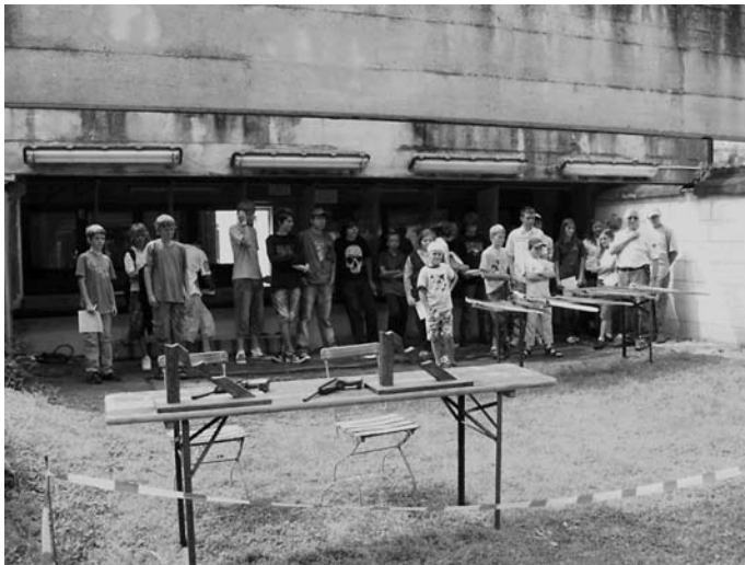
Das Bild zeigt die Teilnehmer des Ferienprogramms bei der SG Brühl auf dem Sportpistolenstand. Dort wurde die Disziplin Luftpistole auf Luftballon und Bogenschießen absolviert.