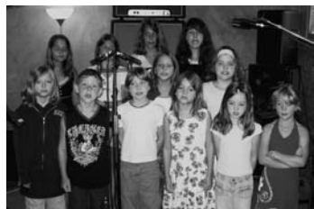
Kennen den Refrain jetzt auswendig: Kinder des KJG-Kinderchore