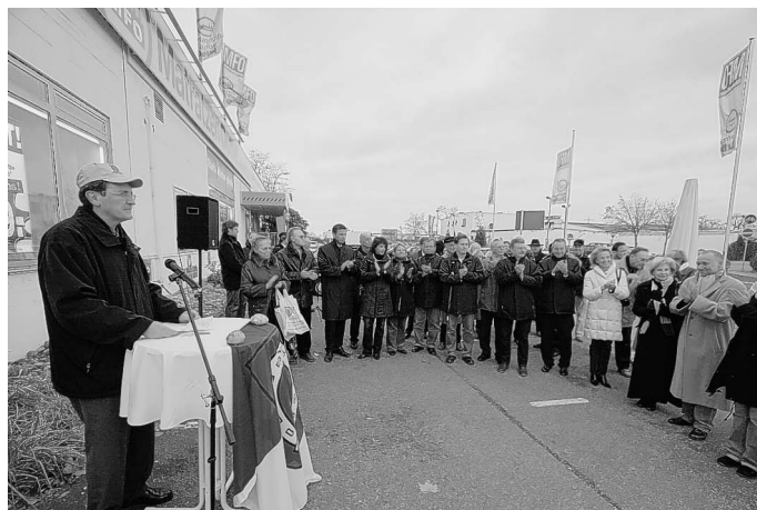
Viele Gäste bei der Kreisels-Einweihung