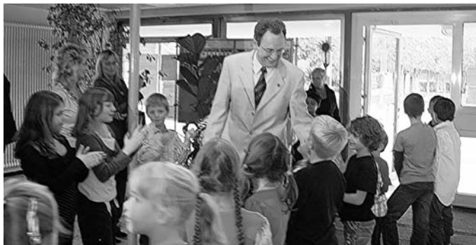
"Spalier" standen die Hortkinder für die Gäste, hier wurde der Bürgermeister begrüßt