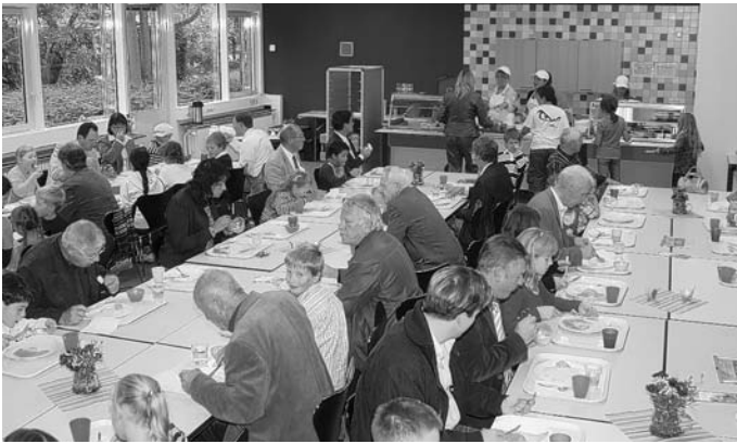
Blick auf die Ausgabetheke - den Gästen schmeckt's

Ein Vorteil der Mensa ist, dass die Bühne vom Musiksaal noch erhalten blieb, und so formierten sich die Kinder auf dieser und demonstrierten gesanglich, was sie gelernt haben: "Also, Kinder, hört mal her, das Einmal vier ist gar nicht schwer, zweimal vier ist acht, wer hätte das gedacht." Bei Kaffee saßen die Gäste noch eine Weile zusammen, während die Kinder schon von ihren Eltern abgeholt wurden.