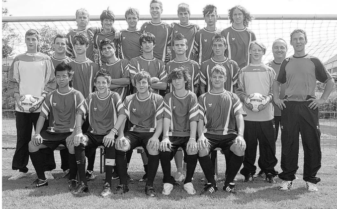
B1-Junioren, Verbandsliga 2008/09

Die A- und B-Juniorenteams des FV Brühl befinden sich seit Anfang der Woche in der Vorbereitung für die am 06.09.2008 beginnende Saison 2008/09. Die Jugendabteilung stellte bereits am 20.07.2008 gemeinsam mit den Herrenmannschaften neben einem sehr anspruchsvollen Rahmenprogramm ihre leistungsfähigen Kader vor.