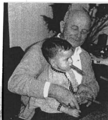
Mit Opa beim Rauchen.