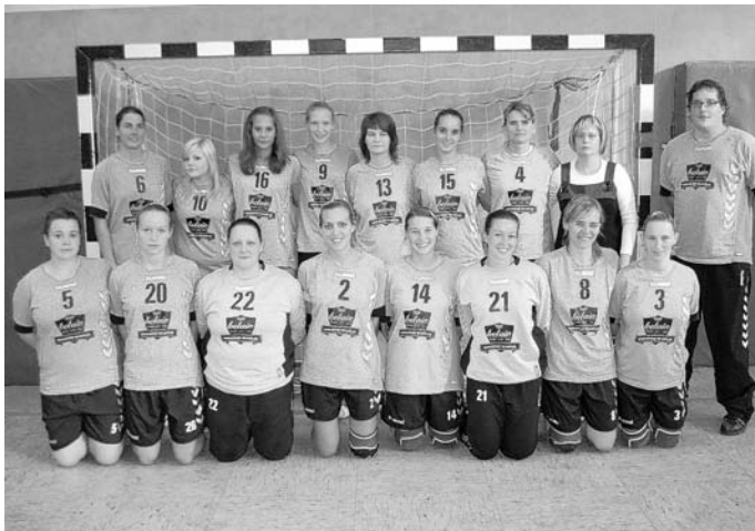
Damenmannschaft des TV Brühl

Die Damen des TVB brennen darauf, dass es endlich losgeht. ako