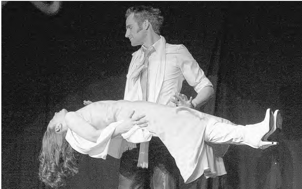
Hier wird scheinbar die Schwerkraft überwunden: der Zaubertrick „Schwebende Jungfrau“

Die gute Stimmung an diesem Abend war keine Illusion und die Gäste der Show „SimSala-Bim“ verbrachten in der Pestalozzi-Halle in Graben-Neudorf einen wirklich zauberhaften Abend.