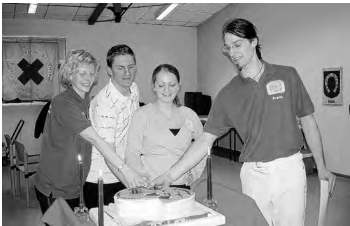
Unsere frisch graduierten Clogger mit unserer Instructorin

Nachdem alle Clogging-Mitglieder noch ein paar Lieder tanzten endete ein wunderschöner Graduation-Abend.