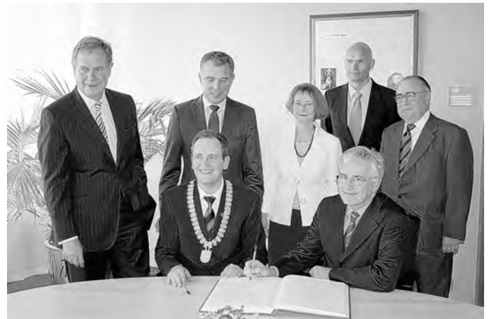
Beim Eintrag ins Goldene Buch mit Prominenten

Erwähnenswerte Initiativen sind auch die seit Jahren laufenden Kinderkleider-Flohmärkte, mit deren Erlösen bisher viel Gutes bewirkt wurde. Auch die Los-Aktion des ASV Rohrhof bei seinem Fischerfest, die fast täglichen Einsätze unserer freiwilligen Feuerwehr und die neue Einrichtung „Aktion 60 plus“, durch die Senioren Schülern durch Nachhilfe und Arbeitsgemeinschaften helfen, den Start ins Berufsleben zu erleichtern.