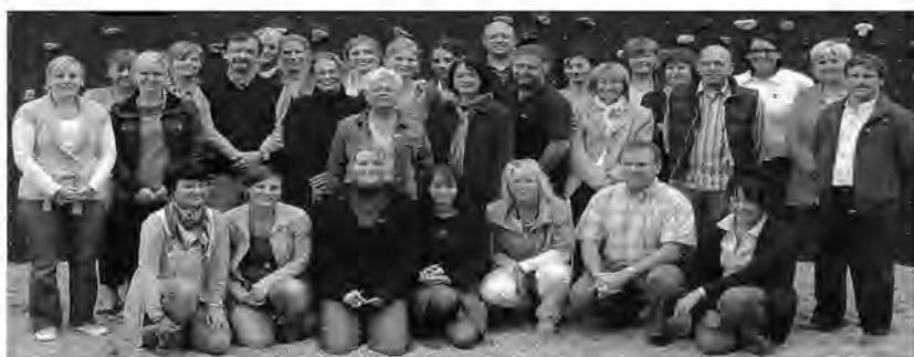
Kollegium der Schillerschule 2010 / 2011 sagt DANKE!!!!!!!