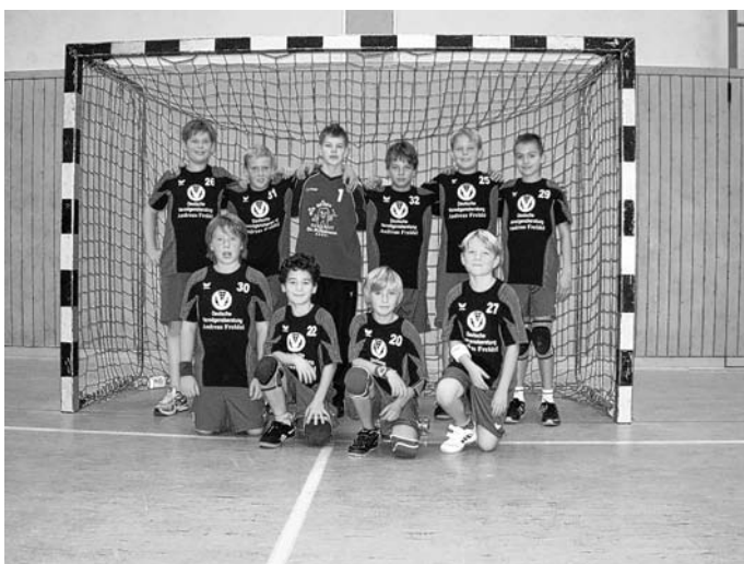
Männl. D-Jugend der SG Brühl/Ketsch ist Staffelsieger