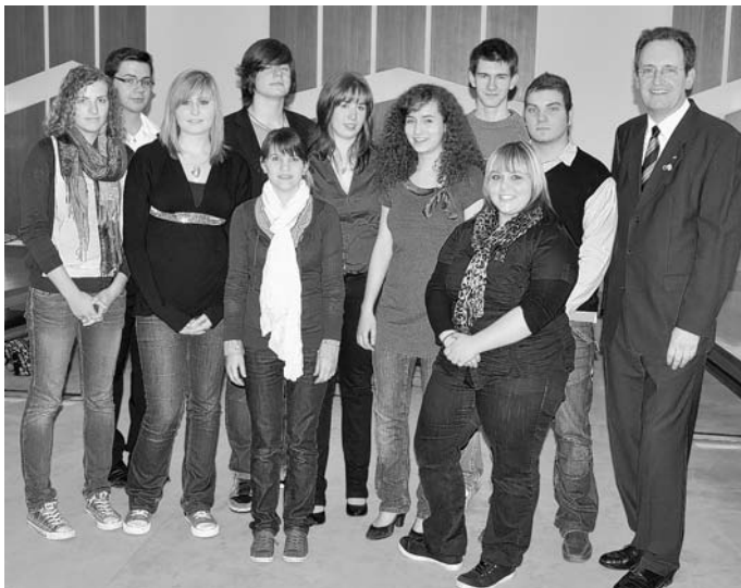
Der neu verpflichtete Jugendgemeinderat