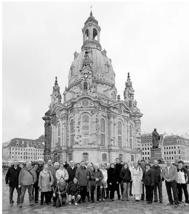
Die 25-köpfige Gruppe aus Brühl und Weixdorfer „Begleiter“ in Dresden

Mit einer Tour durch Dresden und dem obligatorischen Gruppenfoto vor der Frauenkirche ging es weiter, bevor bei einer Schiffstour auch das Umland, die Sächsische Schweiz, in den Fokus rückte. Auf der Heimfahrt machten die Räte Station auf der imposanten Wartburg.