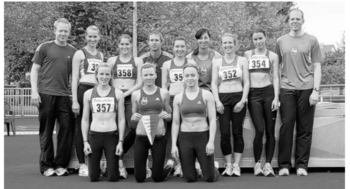
Die Badischen Meistermannschaften der LG Kurpfalz mit den Teilnehmern/innen der ARGE

Bei den diesjährigen Badischen Mannschaftsmeisterschaften am 16.05.10 in Helmsheim konnten die Frauen und Männer der ARGE mit den Mannschaften der LG Kurpfalz die Badische Meisterschaft gewinnen.