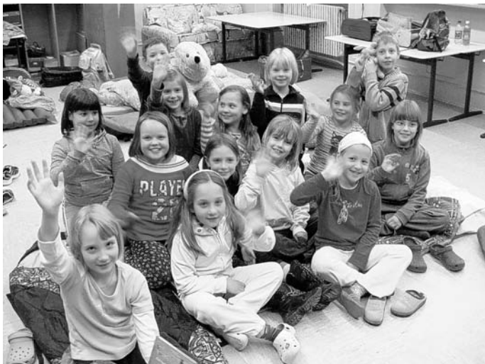
Gruppenbild mit Schlafsäcken: Superstimmung bei der Lesenacht

Eine Isomatte an der anderen, darauf Schlafsäcke, Kissen, das eine oder andere Kuscheltier: ein ungewohnter Anblick im Klassenzimmer. Zum Glück kein Notfall-Szenario, sondern „nur“ die beliebte Lesenacht der Erst- und Zweitklässler der Rohrhofschule, ein kleines Abenteuer für die Kinder.