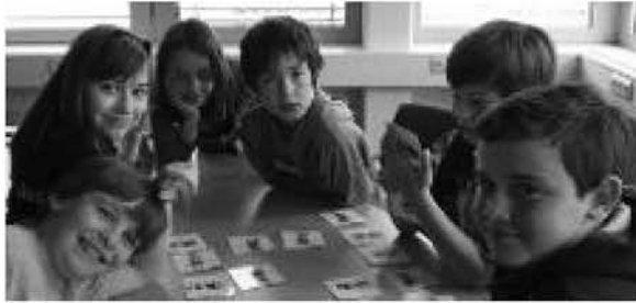
Grundschüler erkunden die Erde von oben