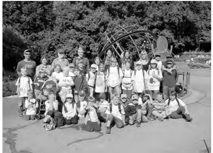
Gruppenphoto im Karlsruher Zoo