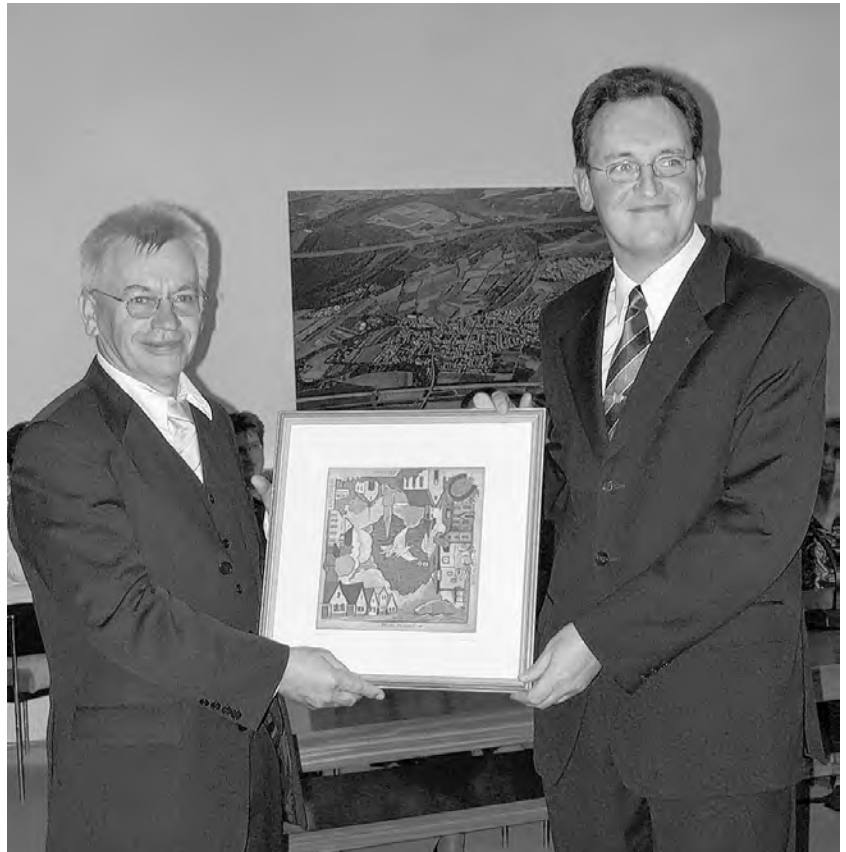
Die beiden Bürgermeister bei einem früheren Treffen in Brühl