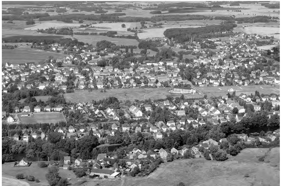
Weixdorf aus der Luft

Wir sind stolz - wir können stolz sein, auf das, was in den vergangenen 20 Jahren hier neu- und wiedererstanden ist, das gilt für die Ortschaft Weixdorf und insbesondere natürlich für Dresden. Wir können stolz sein, dass wir diese Jahre in Freiheit und Frieden erleben durften; dass wir in einem Land leben können, in dem niemand mehr wegen seiner Herkunft, Religion und Meinung bevormundet, unterdrückt und an Leib und Leben bedroht wird.