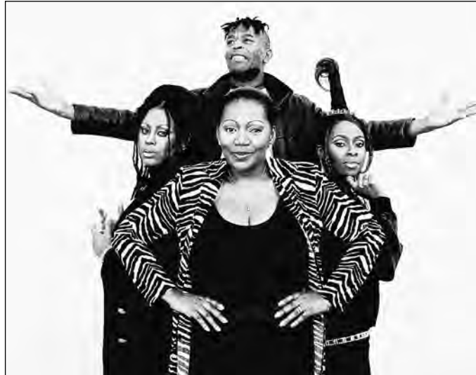
Die Disco-Legende Boney M. tritt bei der Spendenacht live auf