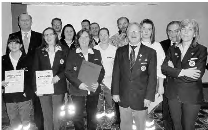
Alle geehrten Brühler Aktiven