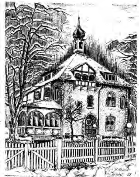
68782 Brühl Schwetzinger Straße 24