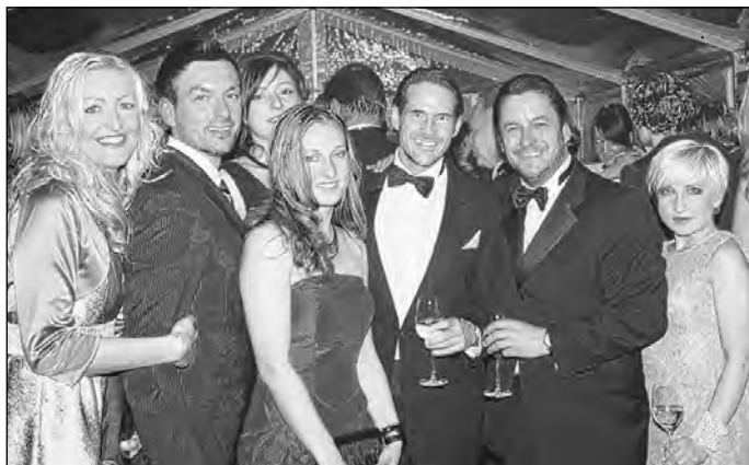
Bei den Gästen herrschte glänzende Stimmung