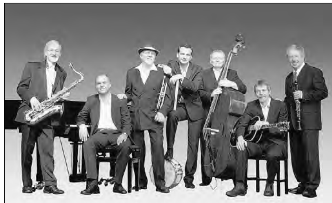
Barrelhouse Jazz Band

Auf Wunsch der JazzInitiative wurde der Schotte John Service, einer der weltweit besten Posaunisten des traditionellen Jazz, für das Konzert in Schwetzingen verpflichtet.