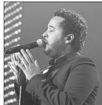
Sänger Adel Tawil von der Band „Ich & Ich“

Über den Eis-Teppich eilten die Gäste in den warmen Rosengarten. Hier bot sich ein Programm der Superlative. Mit insgesamt zwölf Michelin-Ster-