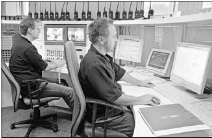
Bilfinger Berger ist der größte deutsche Anbieter für integriertes Gebäudemanagement

Mannheim. (pr). Bilfinger Berger hat seinen erfolgreichen Kurs im ersten Quartal 2011 fortgesetzt. Leistung