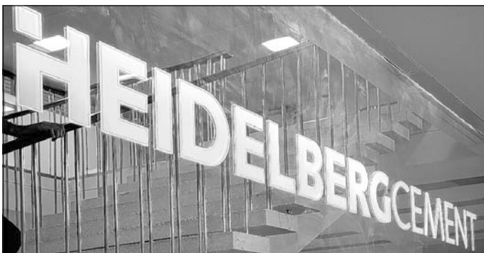
Der Konzern wird aufgrund der Energiepolitik in Frage gestellt