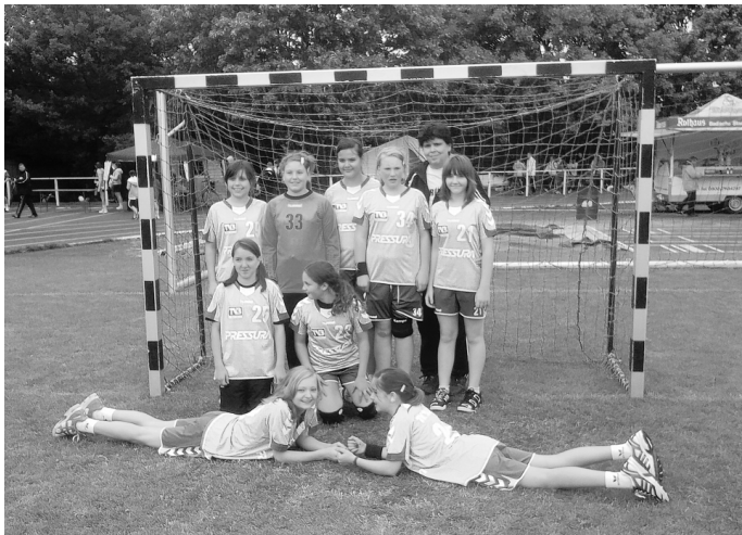
Brühler D 1

Gastgeberinnen, die die beste Mannschaft stellte, eine 6:15-Niederlage. Aber der zweite Platz konnte sich allemal sehen lassen. ako