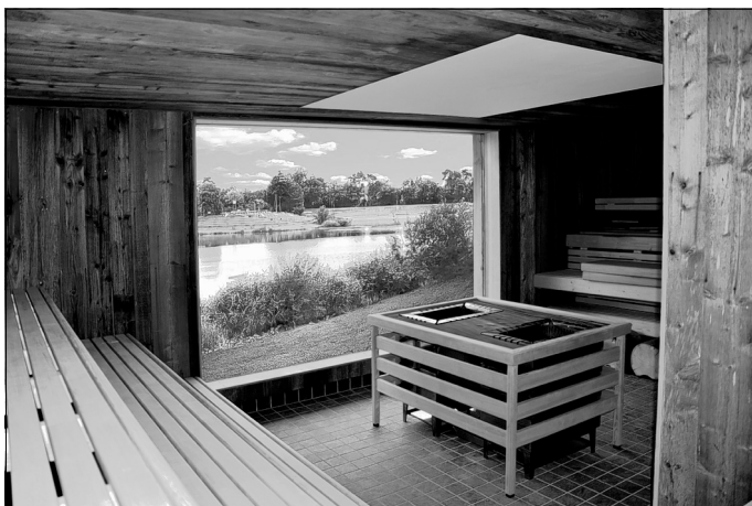
Ein großes Panoramafenster eröffnet vom Saunabereich aus den Blick zum Badesee

Angeboten werden am Eröffnungstag neben Führungen über das gesamte Gelände des Bäderparks auch Sauna-, Fitness- und Entspannungsberatungen durch alle Walldorfer Apotheken. Im Freigelände sorgen Live-Musik und verschiedene Showeinlagen auf der Open-Air-Bühne des RNF-Trucks für Stimmung. Vom gelungenen Wasserflächenkonzept im Inneren des Neubaus kann sich das Publikum unter anderem bei einer Schwimmvorführung der Kinder des Walldorfer Schwimmvereins überzeugen.