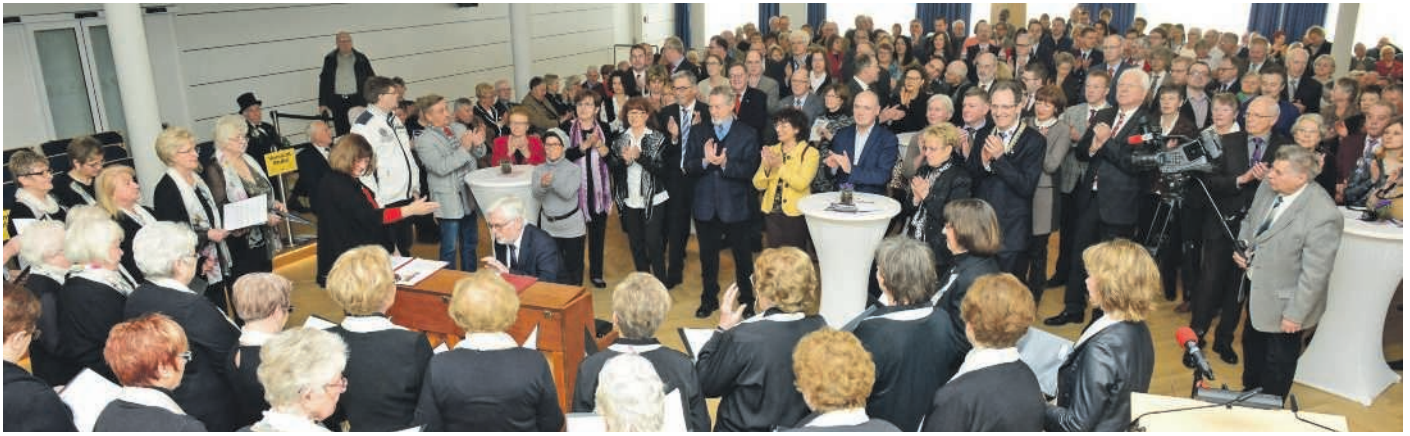
Viel Beifall gab es für die Liedbeiträge des Frauensingkreises