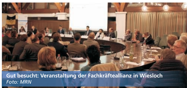
Gut besucht: Veranstaltung der Fachkräfteallianz in Wiesloch

Vom Land unterstützte Fachkräfteallianz Rhein-Neckar erfolgreich gestartet