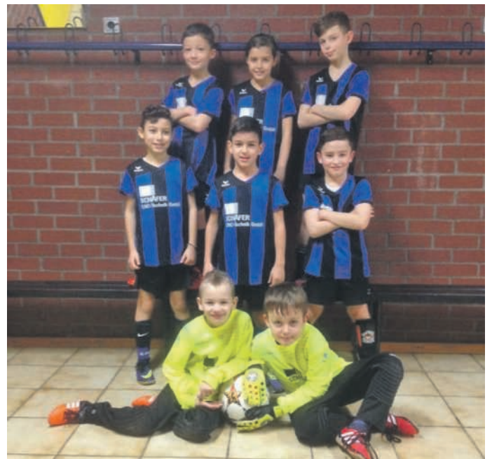
Die Jungs und Mädels der Brühler F1-Junioren zauberten beim Dato Cup in Viernheim und kehrten ungeschlagen nach Brühl zurück