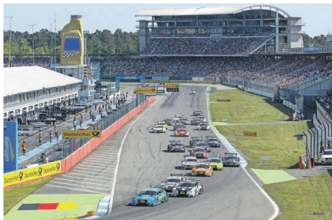
Vom 5. bis 7. Mai feiert die DTM ihren Saisonauftakt auf dem Hockenheimring.

Hockenheim. (pm). Das wird ein Saisonauftakt nach Maß. Die DTM feiert auf dem Hockenheimring Baden-Württemberg von 5. bis 7. Mai die Premiere der neuen, atemberaubend spektakulären DTM-Boliden von Audi, BMW und Mercedes-AMG. Mehr Leistung, weniger Abtrieb und weichere Reifen versprechen ein geändertes Fahrverhalten - anspruchsvoller für die Rennfahrer, aufregender für die Zuschauer. Erwartet werden actionreichere, von Überholmanövern geprägte Rennen. Für das Highlight des Rahmenprogramms sorgen die Drift-Könige der Rallycross-WM - allen voran Audi-DTM-Star Mattias Ekström als amtierender Weltmeister.