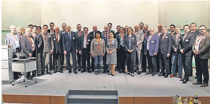
Zufriedene Teilnehmer beim 1. Großen Branchentreff des Nahrungsmittelnetzwerks Rhein-Neckar.

Ende März trafen sich Vertreter der regionalen Nahrungsmittelbranche, um sich erstmals im großen Kreis zu Fachthemen auszutauschen und sich gegenseitig kennenzulernen. Die Veranstaltung war nach der offiziellen Gründung der zweite große Meilenstein zur Etablierung des Nahrungsmittelnetzwerks Rhein-Neckar.