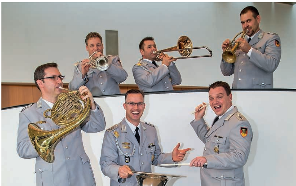
Blechbläserquintett des Heeresmusikkorps Ulm

Das Bundeswehr Sozialwerk engagiert sich seit nunmehr