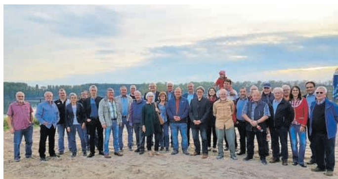
Gemeinderätinnen und Gemeinderäte aus Otterstadt und Brühl vor dem Sonnenuntergang auf dem „Insel-Camping am Kollersee“

Daneben zeigte er das Pumpenhaus, mit der neuen Vakuum-Technik ausgestattete Abwassersystem des Platzes, das seit einigen Monaten problemlos „läuft“, ebenso die Wasser- und Stromversorgung. Das Sanitär-Haus für die Camper ist zwar fertig, es gab aber bereits den ersten Wasserschaden, so dass große Bautrockner den Blick auf die Anlage trübten. Gearbeitet wird noch an der Einrichtung des Bistros, wo außerdem noch eine Terrasse angelegt wird. Das öffentliche WC für die Strandgäste muss ebenfalls noch errichtet werden: „Wir sind auf einem guten Weg“, fasste Schmitt-Köhler zusammen, „auch wenn dieser steinig war und ist“.