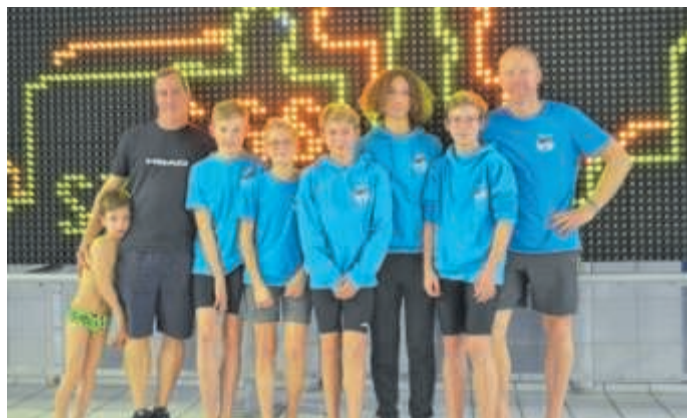
Mannschaft des SV Hellas Brühl

Dann hieß es Abschied zu nehmen und den weiten Heimweg anzutreten.