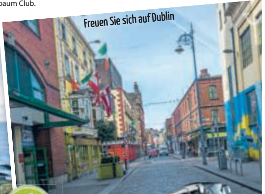
Freuen Sie sich auf Dublin