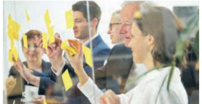
Das Programm der diesjährigen Tagung beschäftigt sich schwerpunktmäßig mit Coaching im Mittelstand.

(red). Die Deutsche Coaching Gesellschaft (DCG) e.V. lädt am 24. November zur 3. Coaching-Tagung nach Heidelberg ein. Das Angebot mit der Schwerpunktsetzung „Coaching im Mittelstand“ richtet sich besonders an Studierende, Unternehmer, Führungskräfte und Coachs.