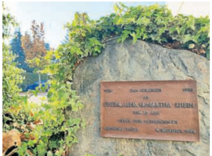
In Brühl will man die Vorgänge des 9. November 1938 nicht vergessen, hier die Gedenktafel beim Rathaus

Beginn ist am 9. November um 17.30 Uhr, die anschließende Gedenkveranstaltung danach etwa um 18.00 Uhr vor dem Rathaus. Beides wird vom Evangelischen Bläserkreis umrahmt.