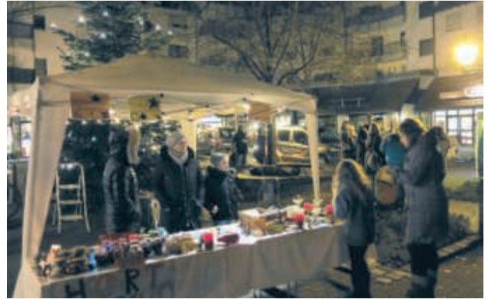
Schönes und Leckeres gab es beim Stand des Horts der Jahnschule auf dem Lindenplatz

Die an diesem Abend zum ersten Mal brennende Weihnachtsbeleuchtung im Ort trug ebenso zum Advents-Feeling bei wie die Glückssterne in den Geschäften, ohne die in Brühl und Rohrhof die Vorweihnachtszeit irgendwie unvollständig wäre. Mit dem Erwerb der als Lose geltenden Sterne tut man bedürftigen Kindern der Gemeinde Gutes, kann aber auch selbst Einkaufsgutscheine im Gesamtwert von 1.000 Euro gewinnen.