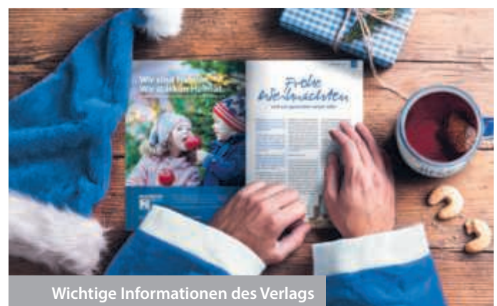
Wichtige Informationen des Verlags