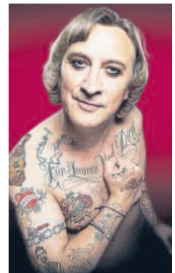
Dieter Thomas Kuhn

benfrohes Happening. Da wird jede U-Bahn zum Schlagerchor. Kuhn-Konzerte sind Familientreffen, die „Kuhnis“ genannten Anhänger sind eine verschworene Gemeinschaft, die jeden gerne aufnehmen. Hier haben alle Spaß, lernen neue Freunde kennen, treffen alte Freunde wieder. Alle feiern mit allen. Hier geht es nicht um Schlager im herkömmlichen Sinn, hier wird Schlager neu interpretiert. Hier geht es um die schönsten Schlager für ein Publikum, das sonst nichts mit Schlager am Hut hat!