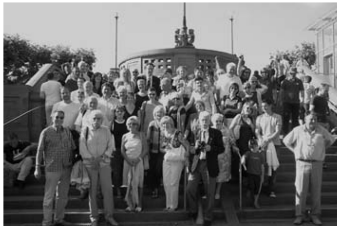
Gruppenbild auf dem Eisernen Steg in Frankfurt. Ein tolles Erlebnis am Rande der Frankfurter WM-Fan-Meile.