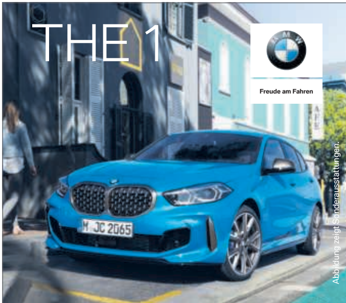
Abbildung zeigt Sonderausstattungen.