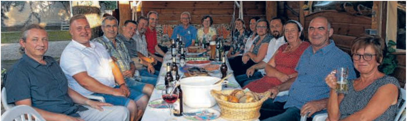
Haufes Ortschaftsratsrunde. Es war ein gelungener, stimmungsvoller Treff, der allen Beteiligten interessante Einblicke eröffnete

Weitere Treffen mit den Weixdorfer Fastnachtern und den Freunden vom Fotoclub Weixdorf „Reflex“ vertieften die Partnerschaft.