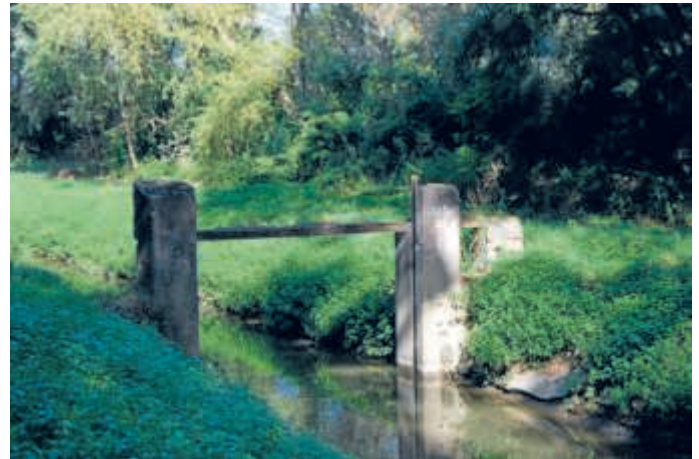
Die Eder'sche Schleuse im Leimbach. Rechts im Bild, wo jetzt die Bäume zu sehen sind, befand sich der Fischteich der Ziegelei Eder. Zuvor hatte man dort die Tonerde für die Ziegel gewonnen.