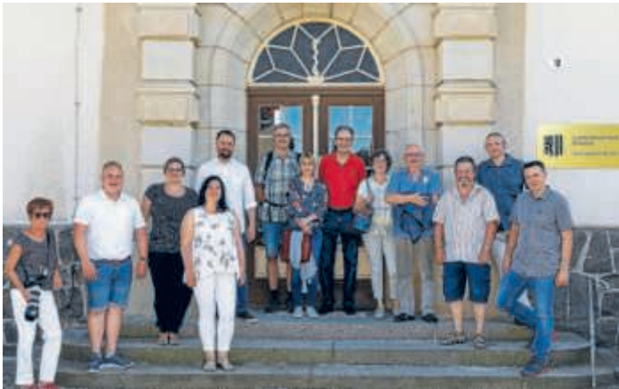
Ausgangspunkt des Rundgangs war das schmucke Weixdorfer Rathaus

„Wenn der geplante Besuch der Brühler Delegation coronabedingt in diesem Jahr schon ausfallen musste, sollte doch wenigstens eine persönliche Begegnung die Partnerschaft pflegen“, sagte Brühls Bürgermeister Göck zur Begründung, warum er mal wieder seinen privaten Urlaub in der sächsischen Landeshauptstadt Dresden plante und natürlich das erste Wochenende in Weixdorf verbrachte. Wie auch bei den zweijährlichen Partnerschaftsbegegnungen gab es zunächst einen Rundgang durch den nördlichsten Dresdner Stadtteil Weixdorf, mit dem Brühl seit 1993 „offiziell“ verschwistert ist, obwohl es auch schon vorher Begegnungen gab. Dreiviertel der Damen und Herren des Ortschaftsrates nahmen trotz der Urlaubszeit am Ortsrundgang vom Rathaus vorbei an der Oberschule, Grundschule, Kirche, Feuerwehr und dem Jugendzentrum teil, was Bürgermeister Dr. Ralf Göck als eine besondere Auszeichnung empfand und für die herzliche Aufnahme und die Gastfreundschaft dankte.