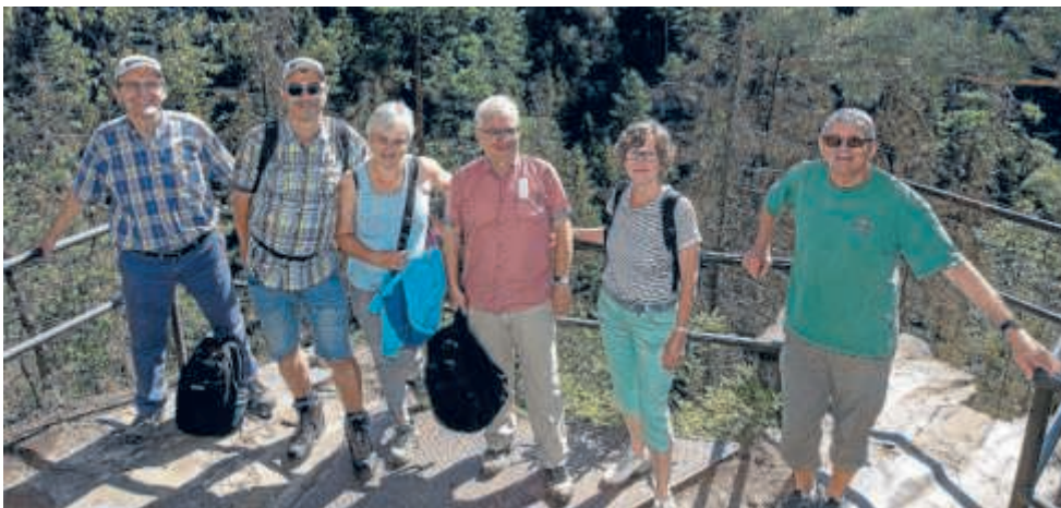
Ein ausgiebiger Wanderausflug im Elbsandsteingebirge der Sächsischen Schweiz bei traumhaft schönem Wetter