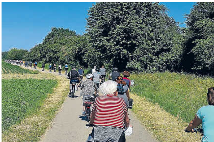
Die Tour führte durch die herrlichen Brühler Rheinauen