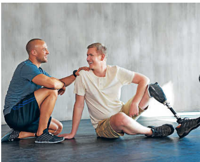
Anpffiff ins Leben unterstützt Menschen mit Amputation. Spenden helfen dabei mit.