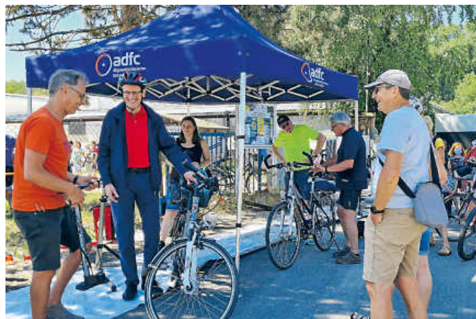
Am Ziel gab es einen Radcheck mit dem ADFC