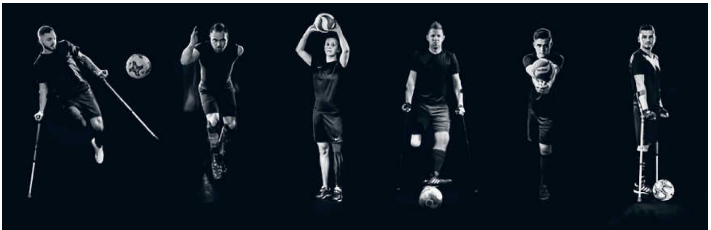
Amputiertensport ist vielseitig - genauso, wie die Schicksale dahinter.