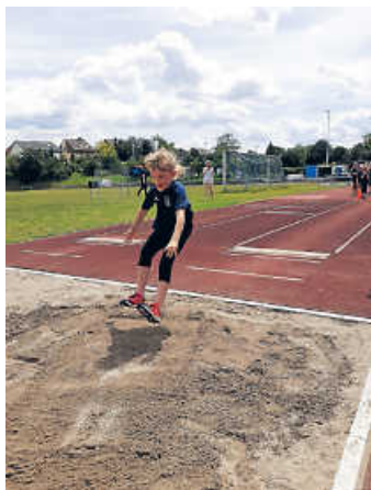
Hoch-Weit-Weiter ... sehr gute Leistung im Weitsprung