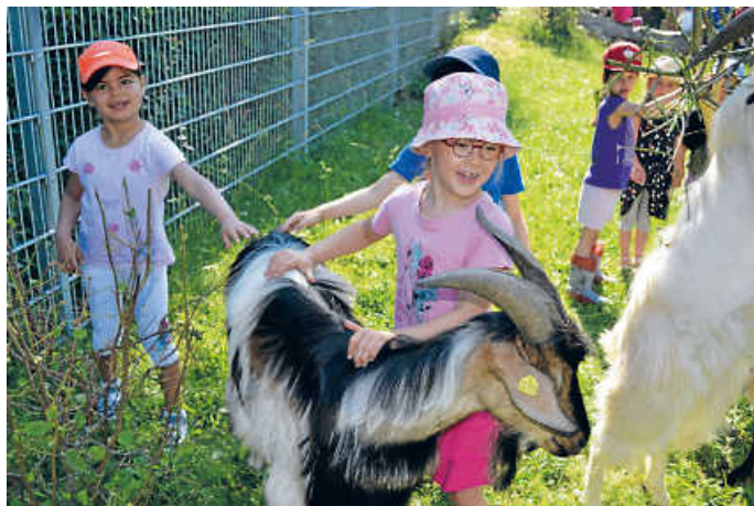
Die Kinder haben viel Spaß und Freude mit den Ziegen