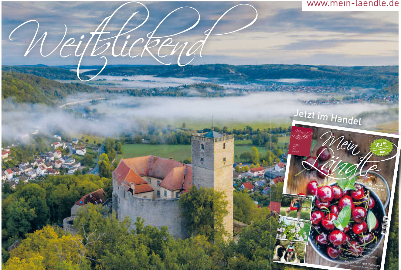
Die Summe der vielen, kleinen Besonderheiten Baden-Württembergs