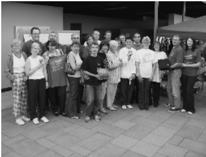
Die Aktiven mit den ersten Sponsoren bei ihrer ersten Präsentation

Zahlreiche Brühler Bürgerinnen und Bürger sind sich einig, dass sie als geschlossene Gemeinschaft einer eventuellen Schließung des Brühler Hallenbades entgegenwirken möchten. Dazu beitragen soll die aktive Sammlung von Spendengeldern. Mit dem "72-Stunden-Schwimmen" vom 13. bis 15. Oktober, welches von Verkaufsaktionen wie T-Shirts, Marmelade und Getränke vor und während der Aktion begleitet wird, hoffen sie, genügend Interesse an dem Fortbestand auch unter jenen Einwohnern zu wecken, die bisher nicht von dem Hallenbad Gebrauch machten.