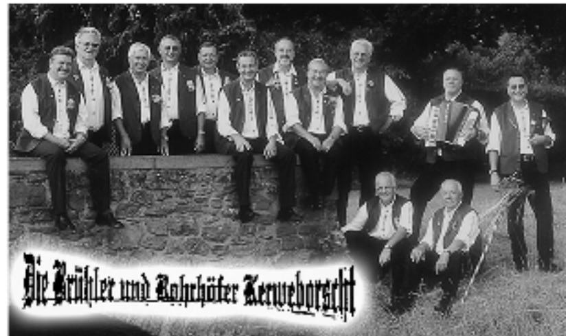
Die Brühler und Bohrhäfer Kerneborst

Bei hoffentlich herrlichem Kerwewetter wünschen die Verantwortlichen drei un- terhaltsame und unver- gessliche Kerwetage.