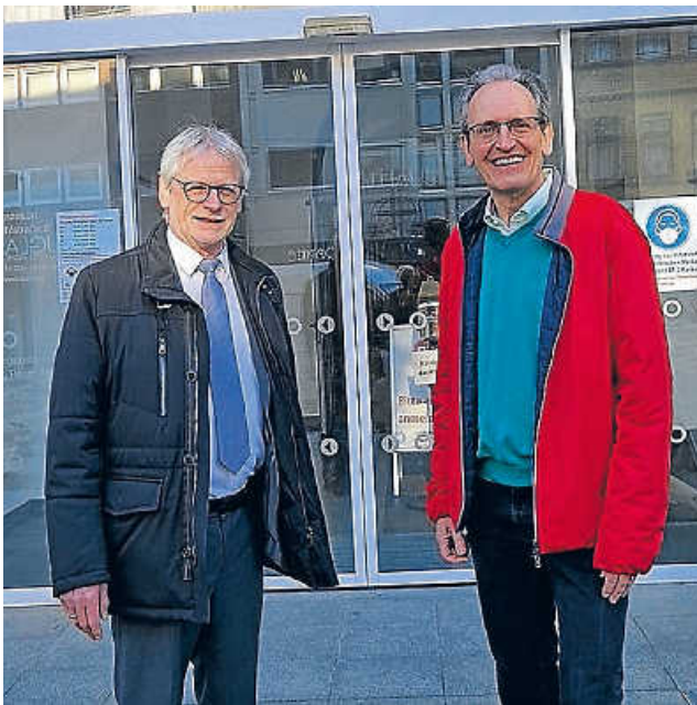
Kurzer Fototermin vor dem Rheinländer Rathaus, dann geht es los ...