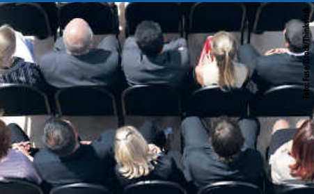
Gemeinderatssitzung am 25.04.2022