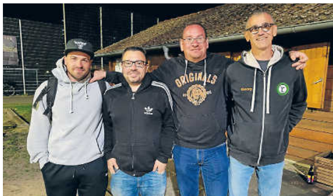
Teilnehmer des Karfreitagsturniers