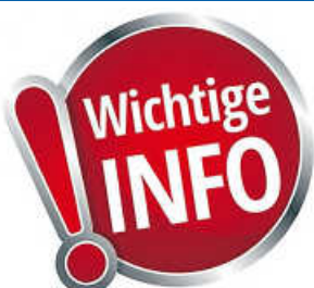
Bauarbeiten Feuerwehr und Görngasse