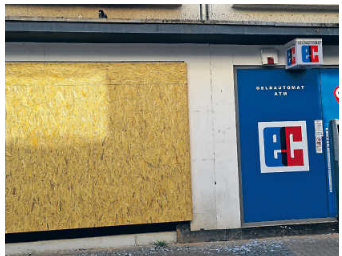
In den Nachbarstädten Brühls, Erfstadt und Euskirchen, hat es im Juli 2021 Flutschäden gegeben: Bis heute sind ein Drittel der Geschäfte in der zwei Meter überfluteten Innenstadt von Euskirchen noch nicht eröffnet