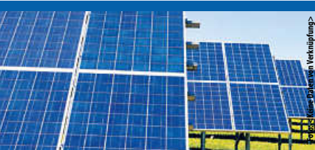
Auftaktveranstaltung zur „Brühler Arbeitsge- meinschaft Klimaschutz“