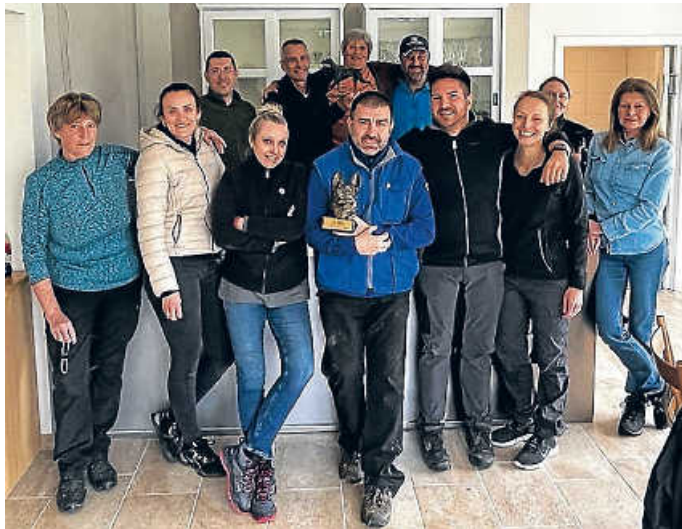
Erster Arbeitseinsatz 2022