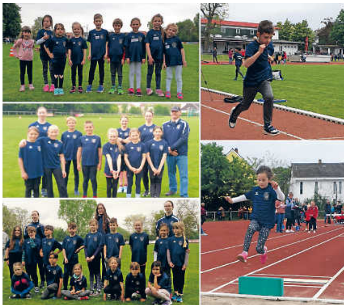
Die FVB-LA-Kids präsentieren sich zum Saisonauftakt

Die Kinder U8 und U10 nahmen erfolgreich am ersten KiLA-Wettkampf in Rohrhof teil. Zweimal Platz 3 und Platz 8 waren die ersten Ergebnisse. Die Athletinnen und Athleten der U12 führten einen Dreikampf durch. Die Zeitnahme erfolgte per Hand. Die weibliche U12 erreichte Platz 2 bis 4, und die männlich U12 Platz 2 und 3. Alle waren mit viel Freude bei der Sache.