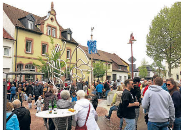
Richtig was los rund um den Goggelbrunnen in Rohrhof: fröhliches Treiben rund um den Zunftbaum am 1. Mai