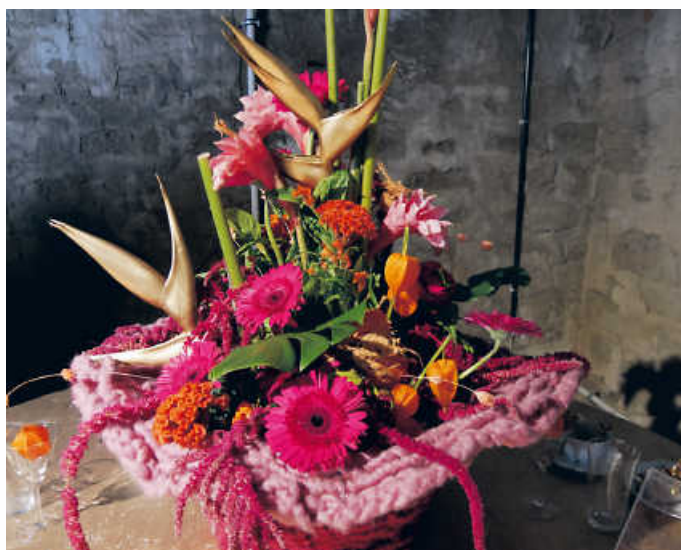
Spannende floristische Arrangements sind noch bis zum Montag auf der 7. Blumenschau zu bestaunen.

Einen spektakulären Höhepunkt bildet das funkelnde Lichterfest am 24. September. Tausende Lichter, Flammshalen und kunstvolle Lichtobjekte verschmelzen gemeinsam zu einem glänzenden Lichtermeer. Bunte Farben und Formen lassen das gesamte Gartenschau-Gelände außergewöhnlich erstrahlen – Den atemberaubenden Schlusspunkt bildet eine Lasershow. (pm/jr)