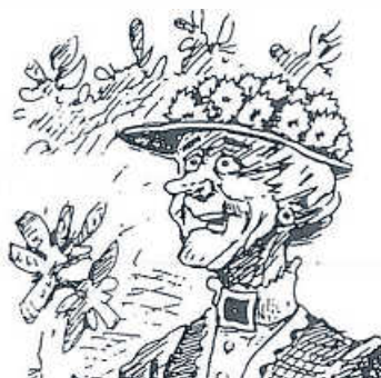
Illustration: Kerweborscht Jochen Ungerer