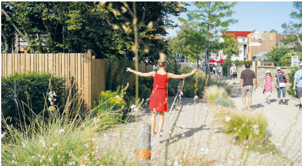
Noch bis Anfang Oktober lassen sich in Eppingen Kultur, Sommer und Natur im Einklang erleben.

Eppingen. 7. Endspurt bei der Gartenschau in Eppingen. Noch bis zum 2. Oktober heißt es in der Fachwerkstadt im Kraichgau „der Sommer, die Stadt und Du!“ Auch im September gibt es hier einige Highlights auf der Festwiese am Weihergelände und an den anderen Stellen der Stadt. Ein Besuch lohnt sich also.