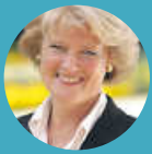
Prof. Monika Grütters

Dazu laden wir mehr als tausend Gäste ein, die sich rund um das Thema Zusammenhalt in der Gesellschaft engagieren – oftmals ehrenamtlich in lokalen Organisationen und Vereinen. Dazu eine ganze Reihe prominenter Speaker, die in Redebeiträgen und Diskussionsrunden verschiedene Teilbereiche beleuchten. Den Tag schließen wir mit einem festlichen Abendkonzert ab.